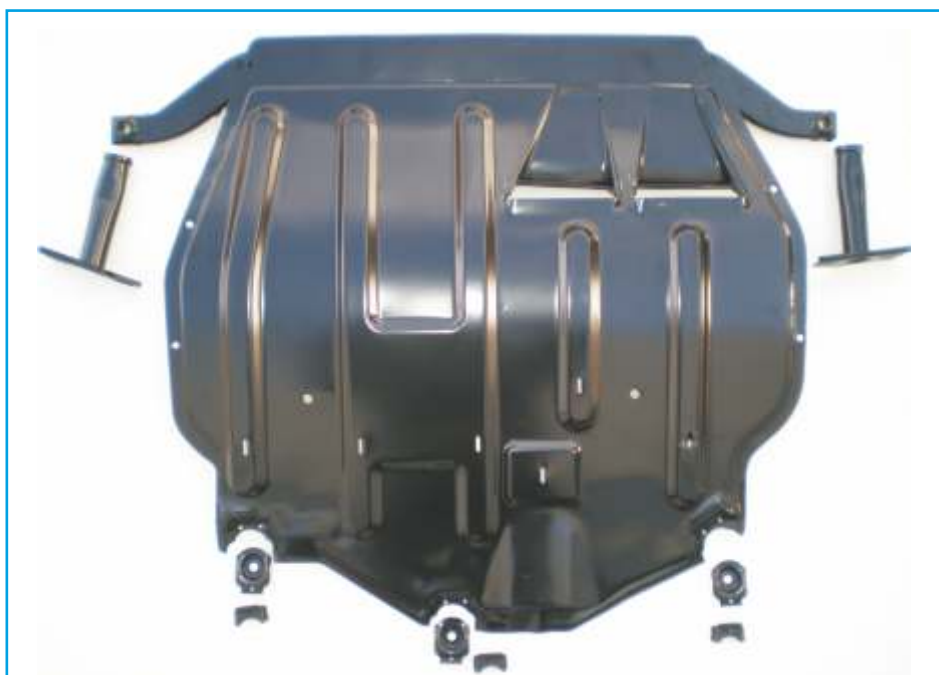
Osłona ze wspornikami

www.skodaczesci.pl/porady/skoda/octavia/75