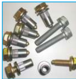
rubki osłony metalowej wraz z tulejkami

Aby uniknąć takich niespodzianek oferujemy Państwu metalową osłonę silnika, dzięki której miska oleju będzie w pełni chroniona przed uszkodzeniem (pani nie), a nasz budżet przed wydatkiem. Osłona silnika jest dostępna ze wspornikami i rubami do montażu.